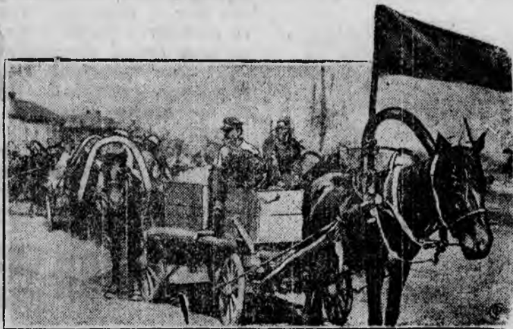
НА СНИМКЕ: КРАСНЫЙ ОБОЗ С ХЛЕБОМ